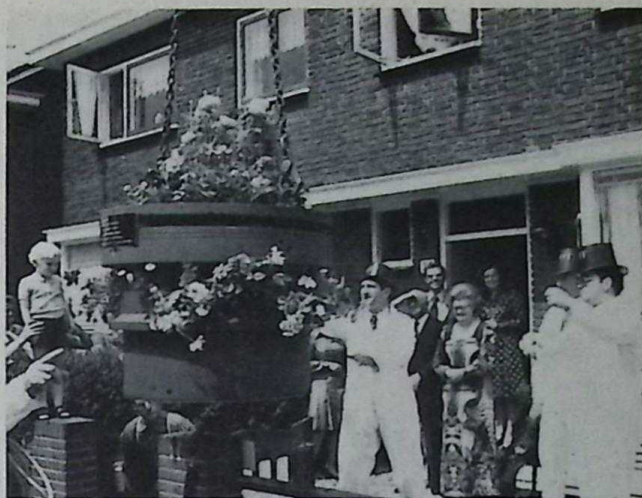
4 Een cilindervoering vol bloemen werd in de voortuin geplaatst.

Alle toespraken werden afgerond met de aanbidding van een cadeau en dat had tot resultaat, dat het gezin v. d. Wilt uitstapend in de mooie spullen kwam te zitten.