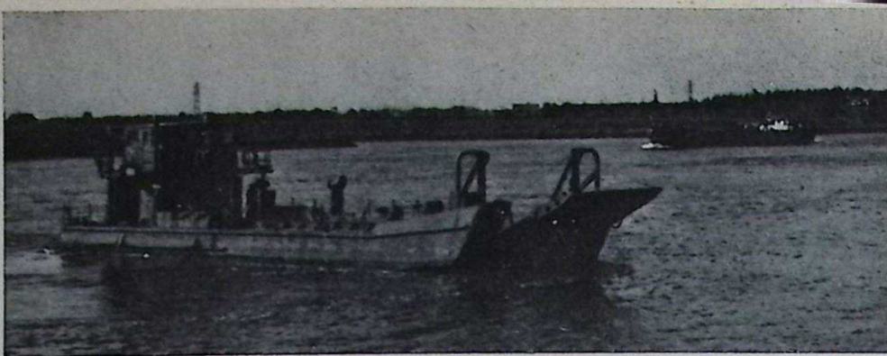
Zo ging het voormalige landingsvaartuig op weg naar v. d. Wetering.