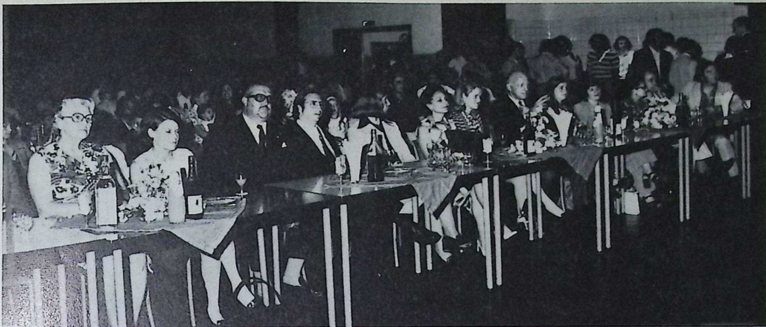
Eretribune / Tribuna de honor