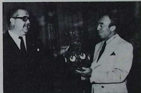
Overhandiging van de vaas / Entregaba un jaron

Sabado 22 de junio llegaba el alcalde de Cadiz a Utrecht para premiar al Caransa trofeo al ganador del torneo de fútbol de los españoles trabajadore en