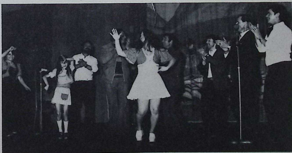
Utrechtse Spanjaarden in actie / El grupo españoles de Utrecht