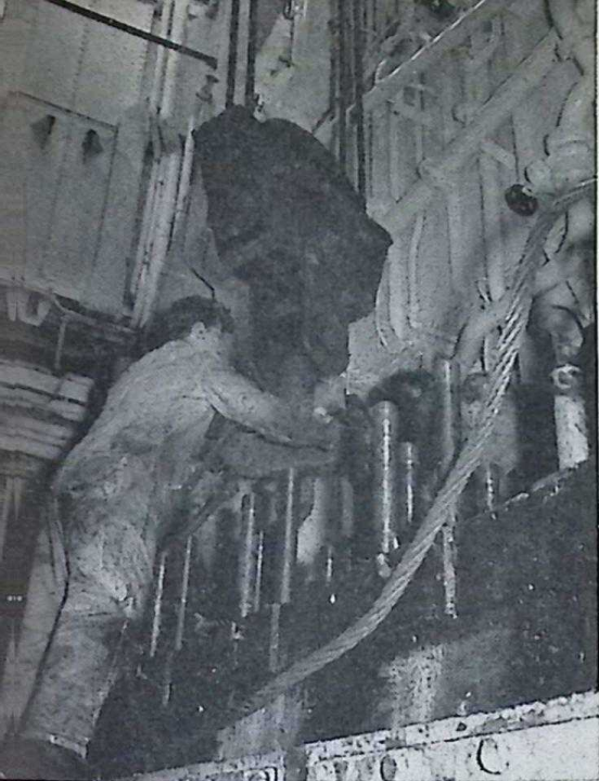
Foto 1: A. Ouwens bevestigt de stroppen om het grote blok van de bok.

Enkele weken geleden kwam het m.s. „Lind” bij ons aan de werf met een gescheurd cilinderblok van de hoofdmotor, een 8-cilinder 4-takt Werkspoor motor met oplading met een vermogen van 1600 pk.