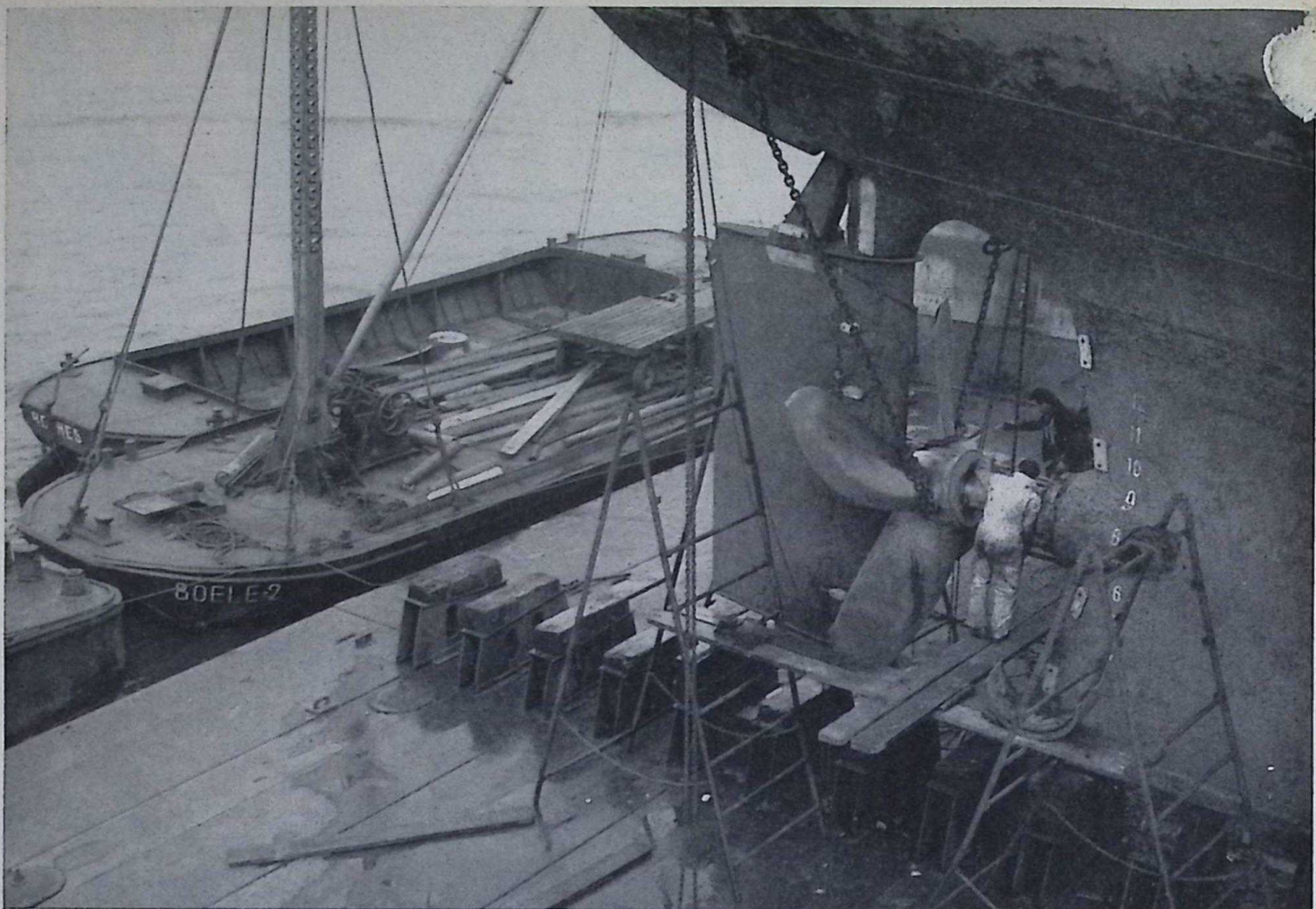
Op deze foto en de foto op pag. 3 ziet u J. Smitshoek, die in het Gemeentedok een schroef afneemt van een zeeschip.