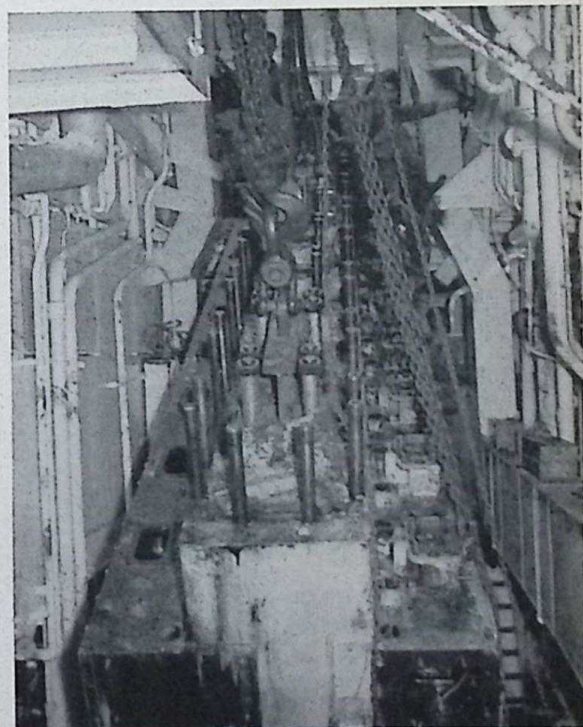
Foto 4: Natuurlijk kon het blok niet rechtstandig omhoog door de schacht en moest voorzichtig gekanteld worden. Hierbij was wat je noemt een schoenlepel nodig om alles vrij te houden.

Foto 5: Zo, dat „vuiltje” is er uit. Iedereen slaakt een zucht van verlichting. Zonder kleerscheuren is het blok boven het schoorsteendeck gekomen.