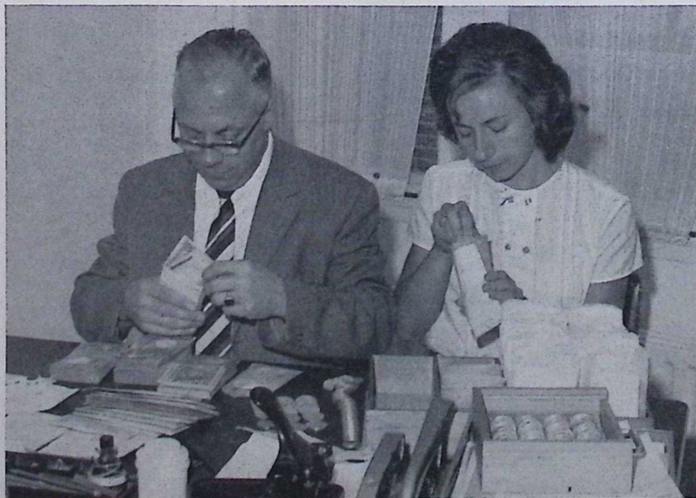
De duiten gaan in het zakje..... een sekuur karwei.