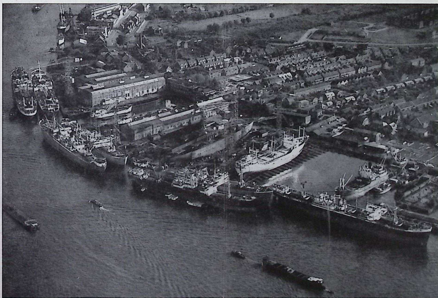
De laatste luchtfoto van ons bedrijf, genomen tijdens de reparatie-herfstperiode op de werf en machinefabriek. Van links naar rechts kijkend ziet U de schepen Apollo, Anastasia, Tamara, Ranger, Seaboard Enterprise, Trader, Cape Sable, St. Gregory, vervolgens de Ørland en op de helling de Alabama.

Zij die in aanmerking wensen te komen voor een vererend getuigschrift van de Nederlandse Maatschappij voor Nijverheid en Handel en voor 1 Mei 1956 — 25, 30, 40 of 50 dienstjaren hebben, kunnen zich tot 1 Maart 1956 opgeven bij afd. Personeelszaken.